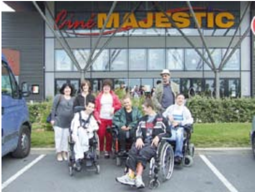
Les cinéastes amateurs et l'équipe d'encadrants