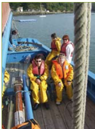
▲ Balade en vieux gréement

Le deuxième séjour se déroulera au bord du lac du Der pour un groupe de six jeunes, du 7 juin au 11 juin. La découverte de la faune et de la flore ainsi que de nombreuses sorties et promenades permettront à ces jeunes de faire connaissance avec le pays du Der.