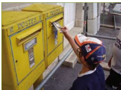
◀ ... à la poste, ...

Dans ce groupe, on apprend aussi à déchiffrer les codes de la ville comme découvrir le rôle des panneaux de circulation, traverser sur un passage clouté en sécurité, se repérer avec les plaques de rue ou chercher un renseignement à l'office de tourisme. Les jeunes sont amenés à utiliser les transports en commun comme le TPMR (Transport pour Personnes à Mobilité Réduite) ou le train. Enfin, ils sont sensibilisés au regard de l'autre, que ce soit les passants croisés dans la rue ou le commerçant à qui ils demandent un renseignement. De retour au centre, un temps de parole permet à chacun d'exprimer ses ressentis.