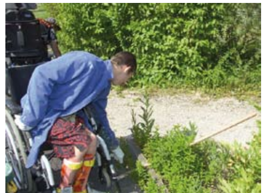
Le courage ne manque pas !

Les premiers coups de pelleuse de l'entreprise AJTP de Fagnières vont retentir courant septembre et les travaux d'extension devraient se poursuivre jusqu'en mai ou juin 2011.