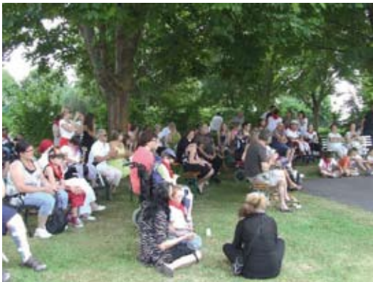
Un public nombreux et attentif

Ce film sera projeté dans les écoles et collèges de Fagnières et de Châlons et il sera suivi de débats au cours de l'année à venir.