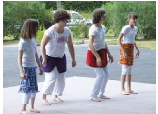
Entrez dans la danse !

Nouveauté à renouveler, la machine à chichi a créé une animation supplémentaire que les gourmands ont beaucoup appréciée.