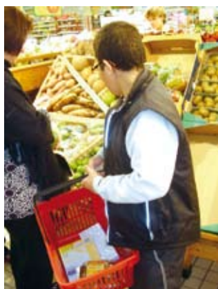
▲ De la grande surface...

L'apprentissage de l'autonomie est au cœur des prises en charge des jeunes de l'Association « Centre de Rééducation Motrice de Champagne ». Le groupe « Vie sociale » mené par une éducatrice et une ergothérapeute a pour but de sensibiliser un groupe d'adolescents à la réalité de la ville. Chaque sortie implique un travail de préparation et d'organisation en amont et amène les jeunes à apprendre à utiliser le téléphone et, en particulier, Internet outil important notamment pour ceux qui ont des difficultés à parler. Les jeunes en fauteuil roulant apprennent à se déplacer en milieu urbain, ils sont parfois confrontés au manque d'accessibilité et doivent apprendre à gérer cet obstacle.