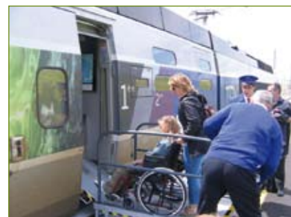
... un train d'enfer... ▶