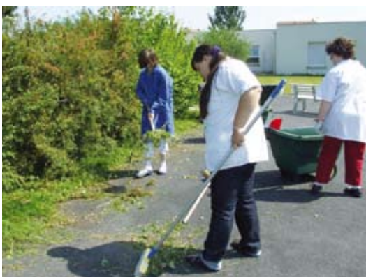
Une équipe studieuse